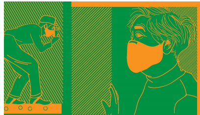
Los movimientos sociales y la educación media: el inicio de una conciencia política