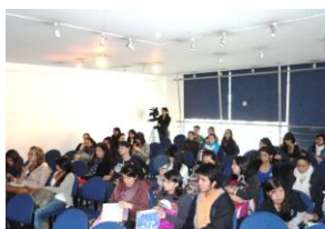
Excelente convocatoria y asistencia al panel.