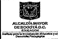
TABLA DE VALORACIÓN DOCUMENTAL